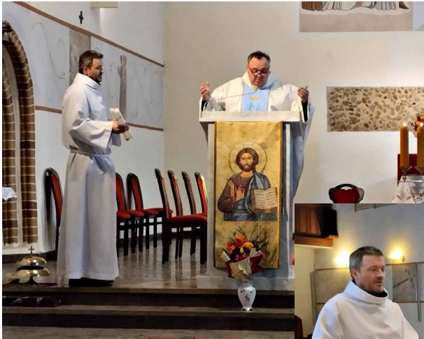
BŁOGOSŁAWIENSTWO ŚW. BŁAŻEJA